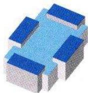
TABELLA DI RIPARTO SPESE D'ESERCIZIO 2018

Ripartizione a carico dei Comuni come da preventivo